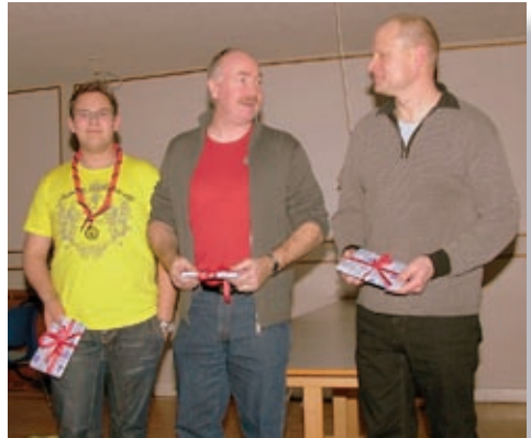
Vinderne fra casino-aftenen

Weekend, 13.-14. marts Mohrondøb (troppen)